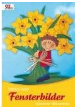
Fröhlich-bunte Fensterbilder OZ 2008 • 32 Seiten • 7,50

Das eine Heft widmet sich ganz der Verschönerung innen: